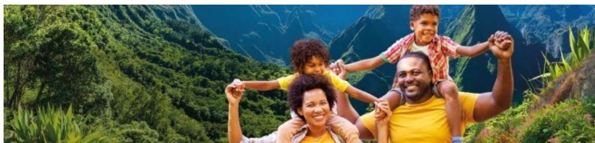
Lettre d'information à destination des partenaires #2