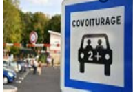
Aire de covoiturage