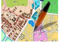
Planification et zonage