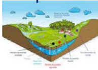
Protection eau potable